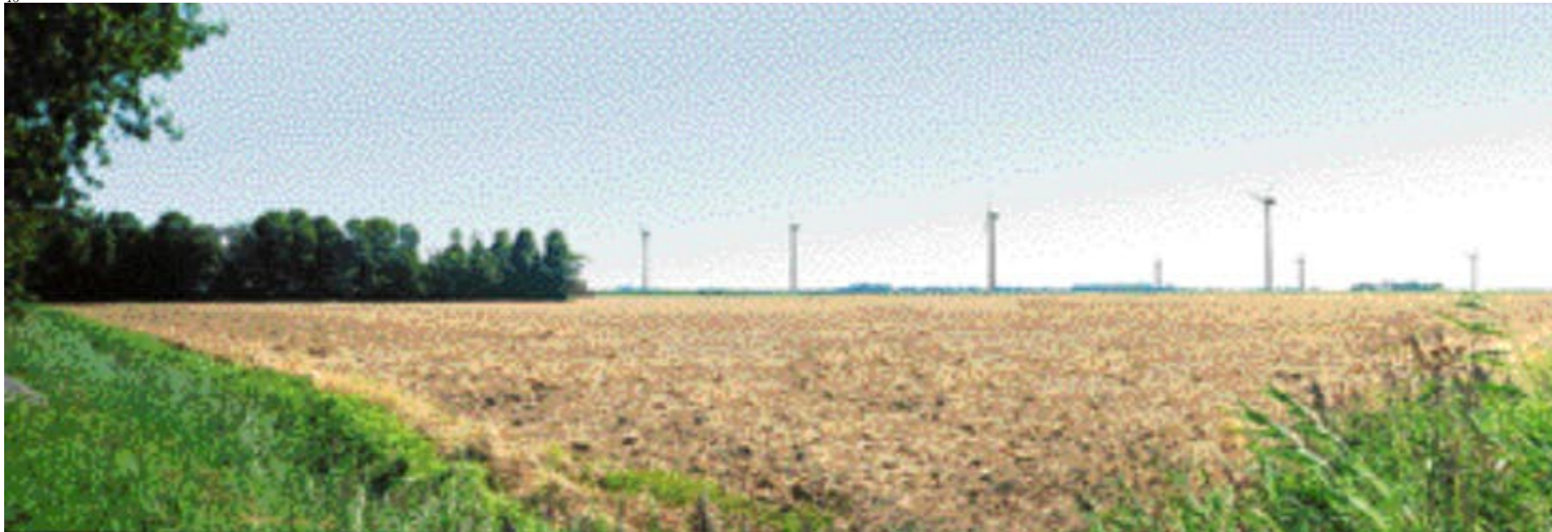
Op het testpark Wieringermeer van ECN (Energieonderzoek Centrum Nederland) kunnen maximaal vier prototype windturbines tot zes megawatt proefdraaien en bemeten worden. Turbinebouwers uit heel Europa komen hier nieuwe modellen testen. Het ECN en de TU Delft openen in de zomer het 'Kenniscentrum Windturbine Materialen en Constructies' (WMC), waar de nieuwe generatie rotorbladen zal worden getest.