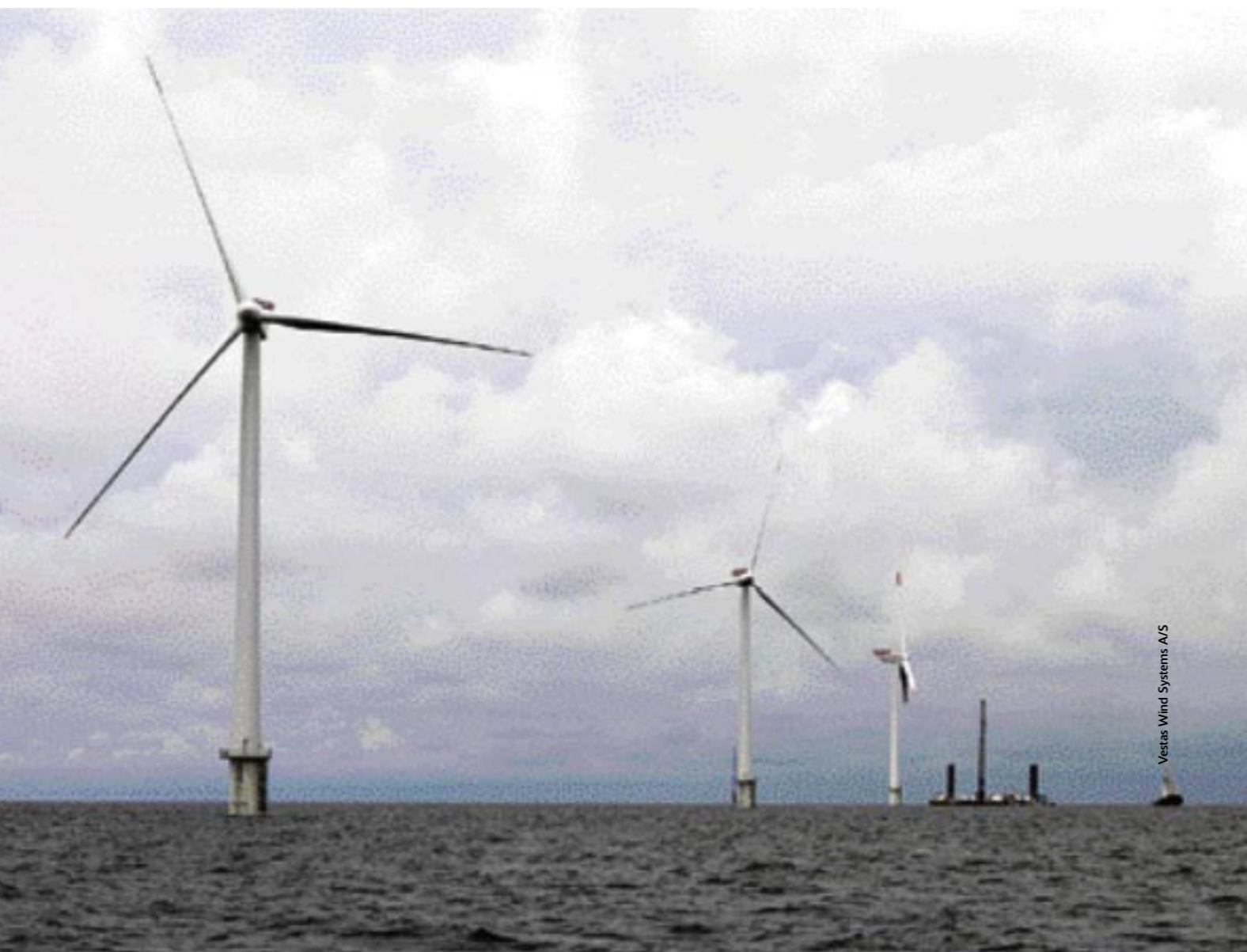
Vestas Wind Systems A/S

In vrijwel alle Noord-Europese landen worden plannen gemaakt voor grote offshore windparken. De Noordzee en de Baltische Zee zijn relatief ondiep en er heersen grote windsnelheden. De eerste echte offshore power plant in de wereld is Horns Rev in Denemarken, waar veertien kilometer uit de kust tachtig gigantische windturbines draaien.