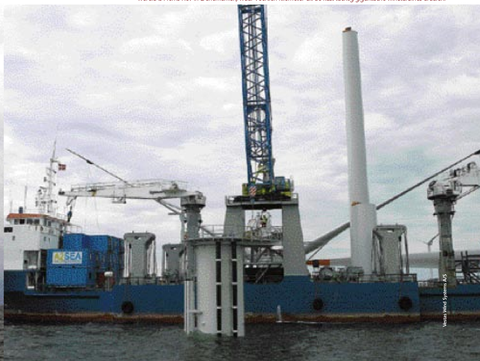
Vestas Wind Systems A/S