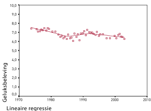
Geluksbeleving in Nederland